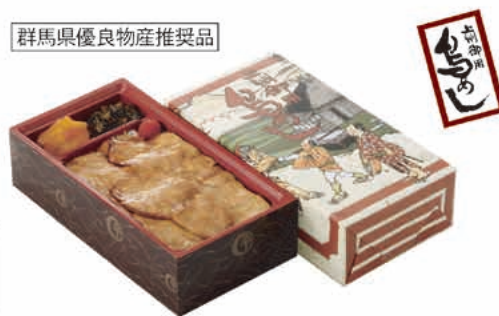
▲上州御用鳥めし弁当<竹>

人気メニュー「上州御用鳥めし」をはじめ、各種バラエティ豊かに取り揃えております。